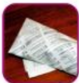
Целлофановый или газетный сверток