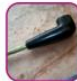
Предметы напомина- ющие курительные трубки