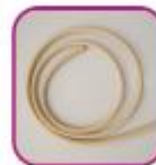
Резиновый жгут, катетер или сверну- тая в жгут ткань