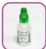
Стеклянный пузырек (из-под нафтизина и пр.)