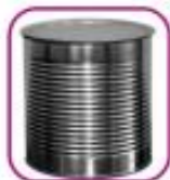
Жестяная банка с вырезанным «окошком»