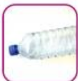
Пластиковая бутылка 0,3-0,5 литров