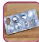
Пустые упаковки от противоаллергиче- ских препаратов